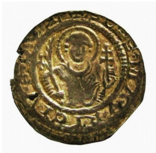
Magdeburg, Erzbisum Wichmann von Seeburg (1152-1192) Brakteat St. Moritz mit Fahne, Schwert und Schild

Dann wurden nach und nach solidere Münzen aus besserem Metall hergestellt, die Gültigkeitsdauer des Geldes erhöht und die „Verrufung“ schließlich ganz aufgegeben. Somit konnte Geld wieder gehortet werden, das dann auch sofort in den Sparstrümpfen, Matratzen und Kästen, damit aber auch gleichzeitig von den Arbeitsplätzen verschwand.